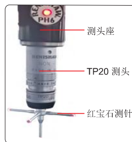
高配探针套装 (选配)