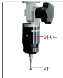
标准探针套装 (选配)